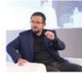
Ali Sabancı Esas Holding Yönetim Kurulu Başkanı VIII. KURUMSAL YÖNETİM ZİRVESİ