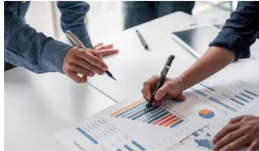
Working Group On Boards Of Directors

The working groups established within CGAT in line with the agenda aim to increase efficiency in the activities of the association.