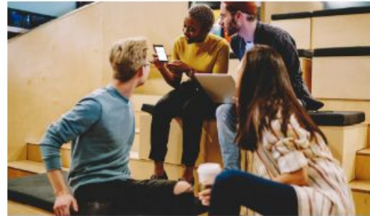
New Generations Working Group