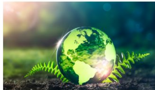
ESG Working Group