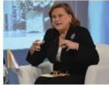
Güler Sabancı Sabancı Holding Yönetim Kurulu Başkanı VI. KURUMSAL YÖNETİM ZİRVESİ