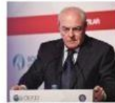
Mervyn E. King, PhD, LLD IIRC Başkanı GRI Onursal Başkanı VII. KURUMSAL YÖNETİM ZİRVESİ