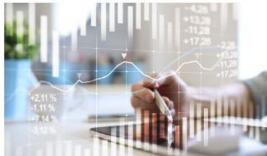
Publicly Traded Companies Working Group & BIST Corporate Governance Index