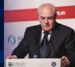
Mervyn E. King, PhD, LLD IIRC Başkanı GRI Onursal Başkanı VII. KURUMSAL YÖNETİM ZİRVESİ