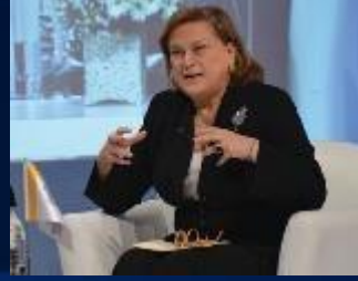
Güler Sabancı Sabancı Holding Yönetim Kurulu Başkanı VI. KURUMSAL YÖNETİM ZİRVESİ