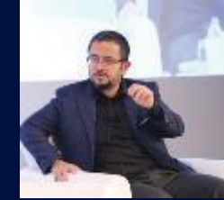
Ali Sabancı Esas Holding Yönetim Kurulu Başkanı VIII. KURUMSAL YÖNETİM ZİRVESİ