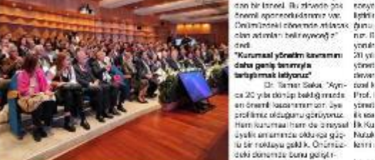
Konferansın düzenleniş yerinde, oturumda uzmanların katılımıyla konuşmalar yapıldı.

Türkiye Kurumsal Yönetim Derneği'nin (TKYD) düzenlediği 14. Uluslararası Kurumsal Yönetim Zirvesi, kamu, iş dünyası ve akademi arasında uzmanların katılımlıyla gerçekleşti. Zirve