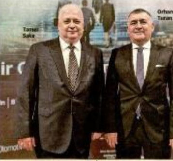
"Daha İyi Bir Gelecek İçin Kurumsal Yönetim"

İçerisinde birleşen iki kavramın birleşmesi en doğru yaklaşım. Kurumsal yönetim, sürdürülebilir güven inşa etmenin temelini oluşturuyor. Türkiye'nin potansiyeli çok büyük, bunu harekete geçirmek için kurumsal yönetimin bürokrasi değil, büyümenin anahtarı olduğunu anlamamız gerekiyor" diyor.